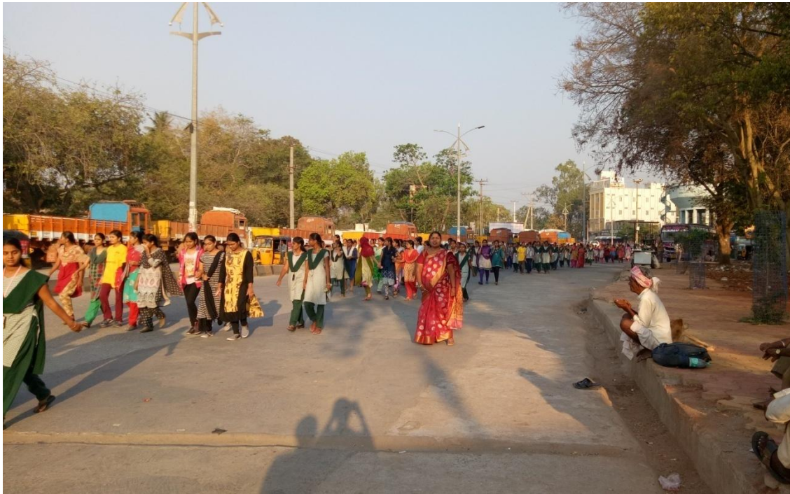
Women's day Rally on 8-3-2018