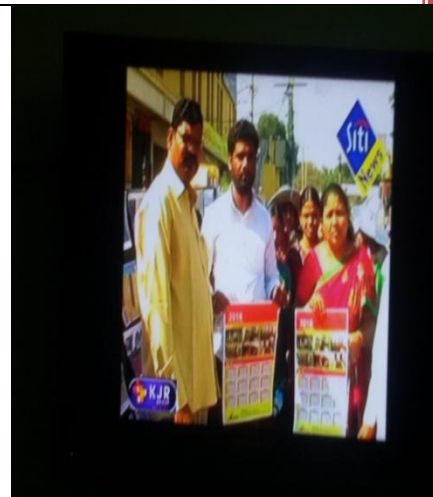
RALLY AND POSTER PRESENTATION IN COLLECTOR OFFICE ON SWACHH VIDYALAYAON 31-12-15 BY NSS VOLUNTEERS.