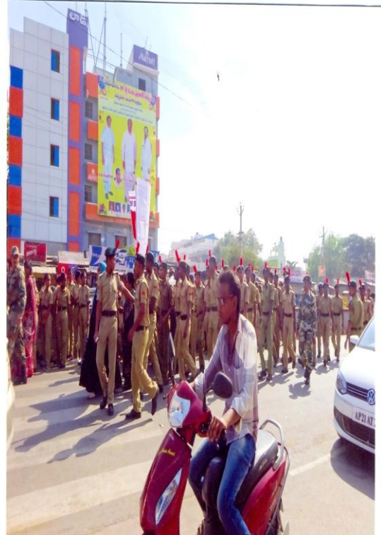
Figure 2 Rally on World AIDS Day