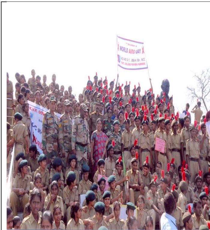
Figure 1 Rally on World AIDS Day