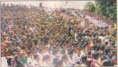
ప్రతిజ్ఞ చేస్తున్న విద్యార్థులు