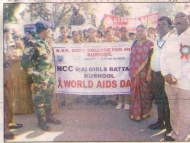
ప్రజాత్మ ప్రదర్శించిన ఎన్ఎస్ఎస్ విద్యార్థులు